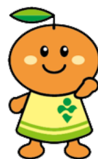
事業団公式マスコットキャラクター リはみん