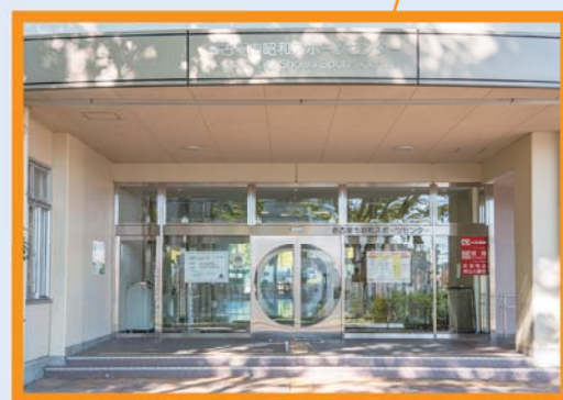
入り口に入ってまずは受付へ。