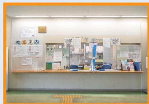
障害者手帳を掲示してください。