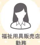
福祉用具販売店 勤務

おむつに対して全く無知だったのですが、ギュッと凝縮された2日間の研修で、おむつについてよく知ることができました。お店の前におむつ選びの専門家のポスターとのぼり旗を立てたところ、それを見て相談に来られたお客様も増えました。