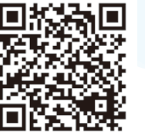
「おむつ選びの専門家」MAP