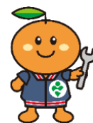
事業団マスコットキャラクター りはみん

＜主催・問い合わせ＞ 社会福祉法人名古屋市総合リハビリテーション事業団 なごや福祉用具プラザ 〒466-0015 昭和区御器所通3丁目12-1 御器所ステーションビル3F TEL: 052-851-0051 FAX: 052-851-0056