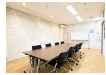
⑤ 会議室 ●面積/30.2㎡ 12名程度の会議等にご利用いただけます。