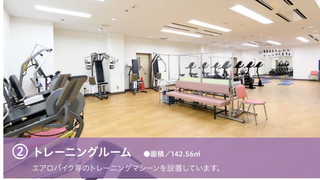
② トレーニングルーム ●面積/142.56㎡ エアロバイク等のトレーニングマシンを設置しています。