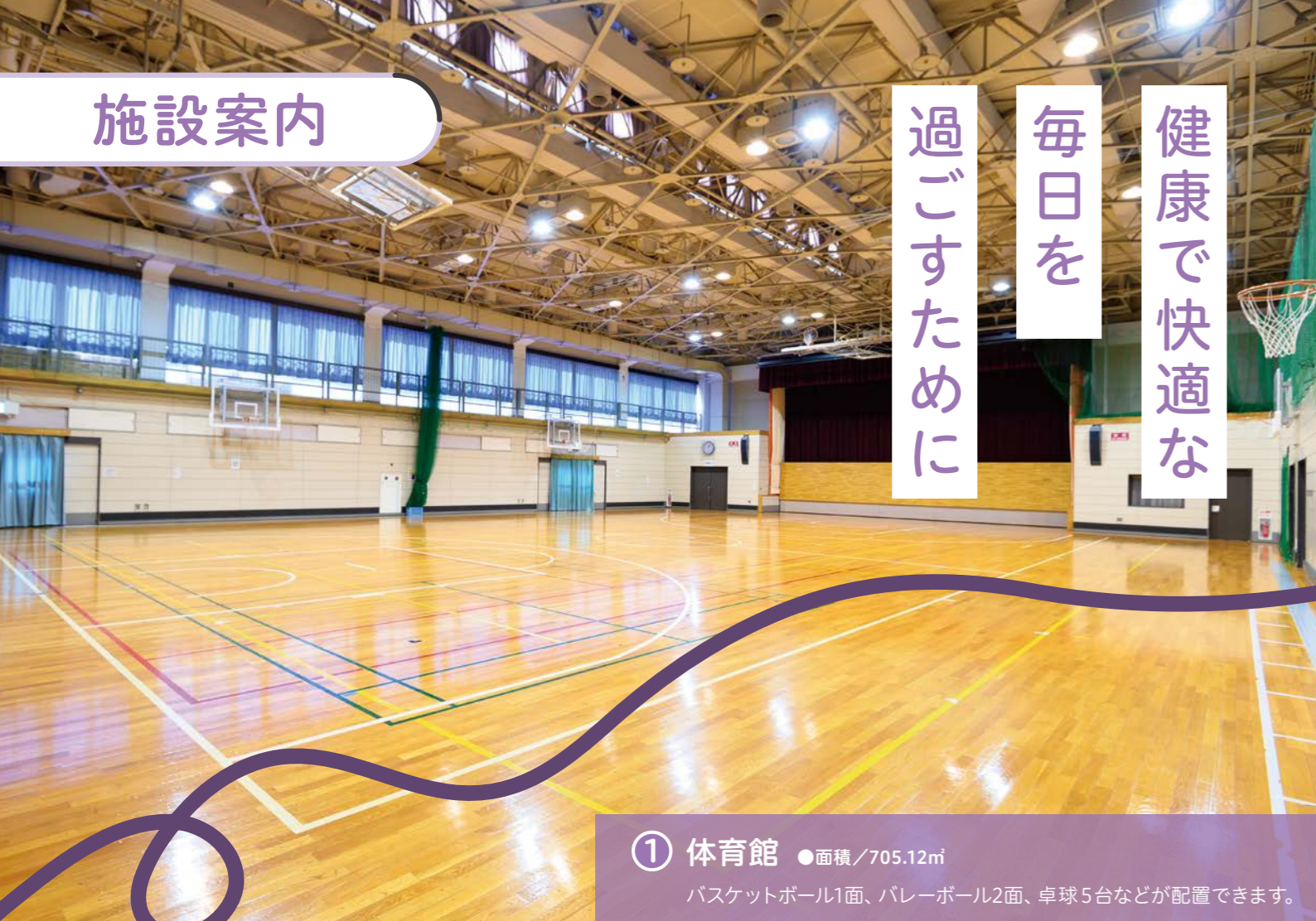
① 体育館 ●面積/705.12㎡ バスケットボール1面、パレーボール2面、卓球5台などが配置できます。