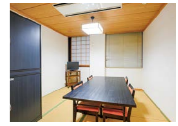
⑥ 和室 ●面積/20.69㎡ 8畳の和室です。平日夜間、土日祝にご利用いただけます。