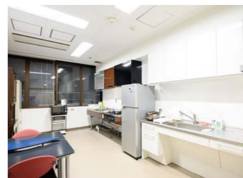
④ 料理実習室 ●面積/29.9㎡ 調理台2台を設置しています。そのうち1台は、高さを調節することができます。