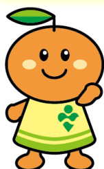
事業団マスコットキャラクター 「りはみん」

今、介護現場では労働の負担や介護人材の不足など深刻な課題が山積みです。その解決策の一つに日本の介護ロボット技術の活用が期待されています。利用者が安心して介護を受け続けることができ、介護職員も安心して長く働ける職場づくりを考える方に、なごや福祉用具プラザでは介護ロボット等の導入・活用を支援しています。業務の改善、介護人材の定着をお考えの方は気軽にお問い合わせください。