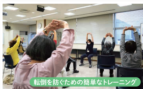
転倒を防ぐための簡単なトレーニング