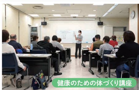
健康のための体づくり講座