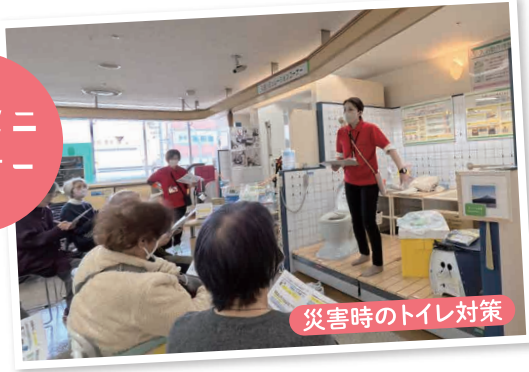
災害時のトイレ対策

防災ミニセミナーでは「災害時のトイレ対策」をテーマに、防災用簡易トイレの使い方や備えのポイントをご紹介します。水や食料と同じくらい大切な“トイレ問題”について、におい対策や処理方法など具体的な質問が次々と寄せられ、防災への関心の高さがうかがえました。