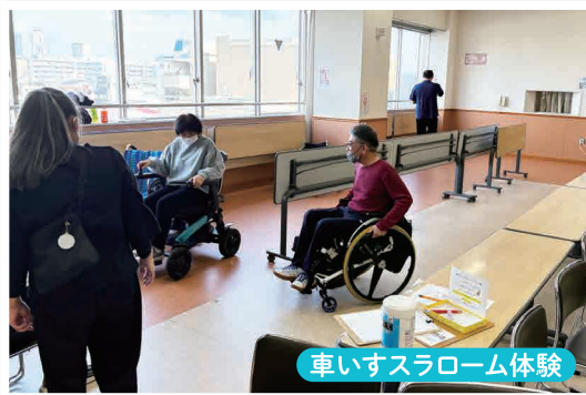
車いすスラローム体験