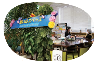
ハンドマッサージ