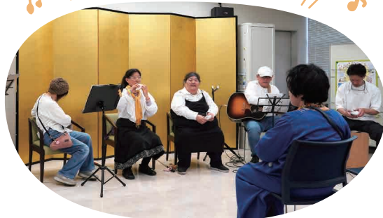
リトルグースによるミニコンサート