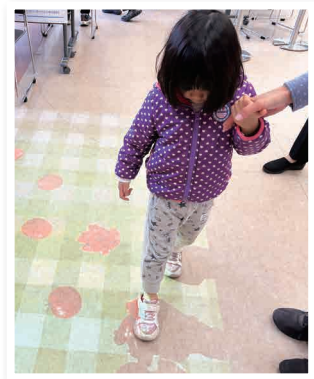
プロジェクション 映像を使用した レクリエーション体験

これからもなごや福祉用具プラザは、地域の皆さまが楽しく参加できるイベントを通して健康で安心した暮らしを応援していきます。