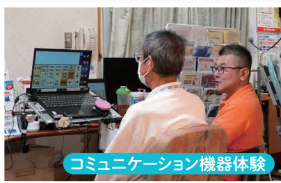
コミュニケーション機器体験