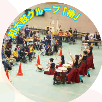
和太鼓グループ「椿」

2階では障害者スポーツ体験、愛知ろう鉄道模型クラブによる鉄道模型の一般公開、フラミンゴアーチェリークラブによるアーチェリー紹介ブース、地域の幼稚園・保育園児による作品展示コーナーも開催されており、フェスティバルがより一層活気づいていました。