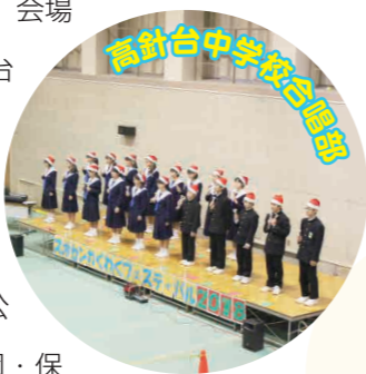
高針台中学校合唱部

体育室のメインステージでは、高針台中学校合唱部のパフォーマンス、ボランティアサークル「名東フレンズ」によるバルーンパフォーマンス、社交ダンス・ダンスダンスの発表、和太鼓グループ「椿」による和太鼓演奏を披露していただき、会場を盛り上げていただきました。またステージと並行して、実行委員による屋台販売、屋外では貴船学区連絡協議会の皆さまのご協力による餅つき大会が開催されこちらも大盛況でした。