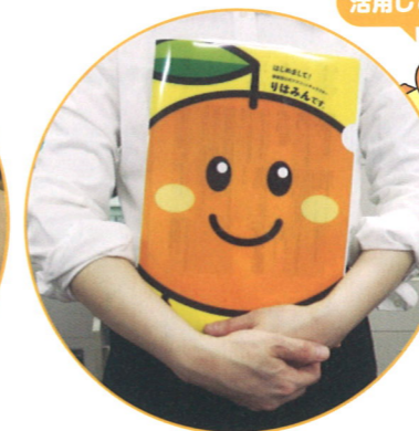
画像2 クリアファイル