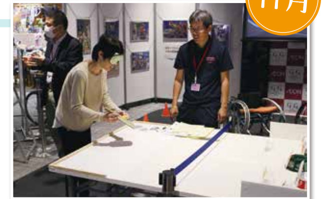
▲サウンドテーブルテニス体験