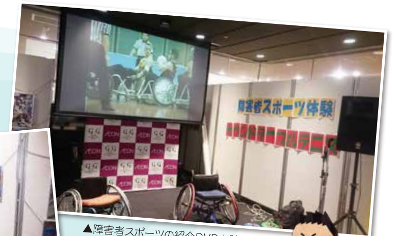
▲障害者スポーツの紹介DVD上映