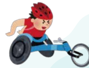
▼北京パラリンピック パネル写真展示