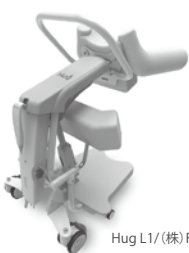
Hug L1/ (株)FUJI